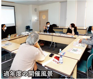
過年度の開催風景