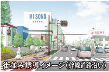
街並み誘導イメージ(幹線道路沿い)