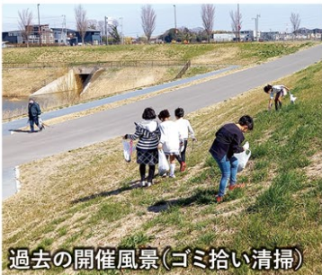
過去の開催風景(ゴミ拾い清掃)