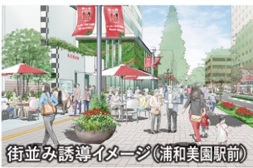
街並み誘導イメージ(蒲和美園駅前)