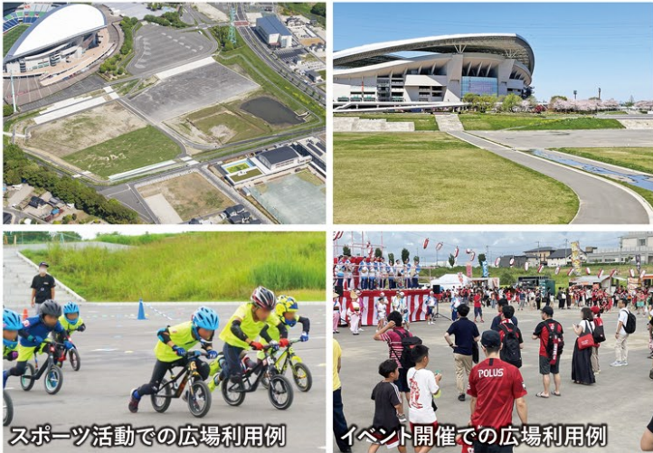
スポーツ活動での広場利用例