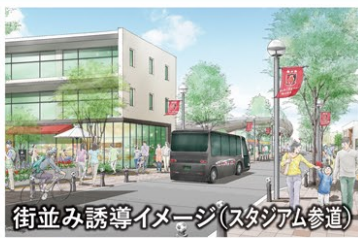
街並み誘導イメージ(スタジアム参道)