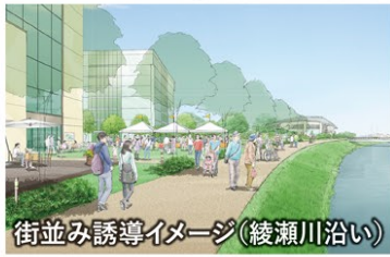
街並み誘導イメージ(綾瀬川沿い)

街並み・住環境の維持・向上のため、景観条例等の既存ルールに加えて、本地区独自の“推奨指針”として『街並みデザインガイド』による街並み誘導に取り組んでいます。建築行為等を行う際には、各種法令手続きに加え、同『ガイド』に基づいて構想・計画段階からデザイン相談いただくことを推奨しています。