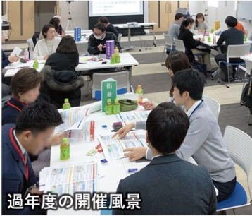
過年度の開催風景