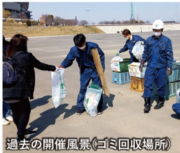
過去の開催風景(ゴミ回収場所)